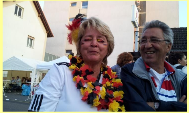
...Fußball war auch...