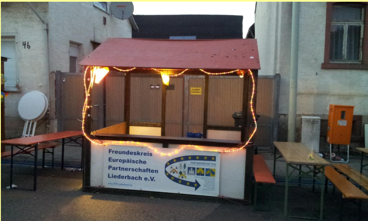
...feddisch bzw. leergegessen !!