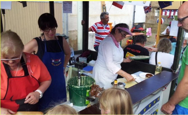
...alles im Griff