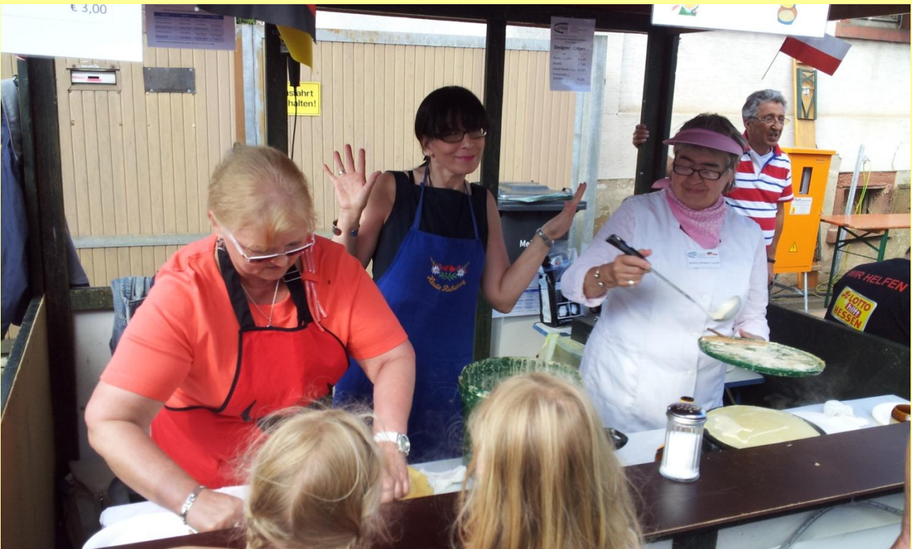
...und schon macht's Spaß !!