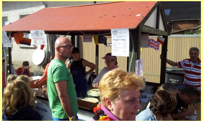
...alles im Griff