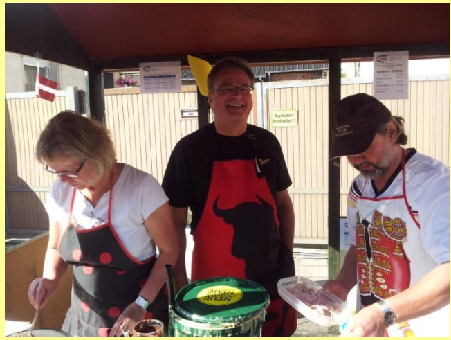
... und schon macht's Spaß !!!