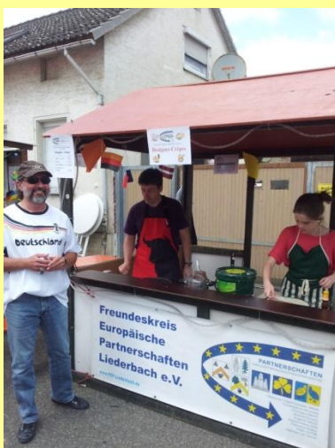
...noch hammer frei...