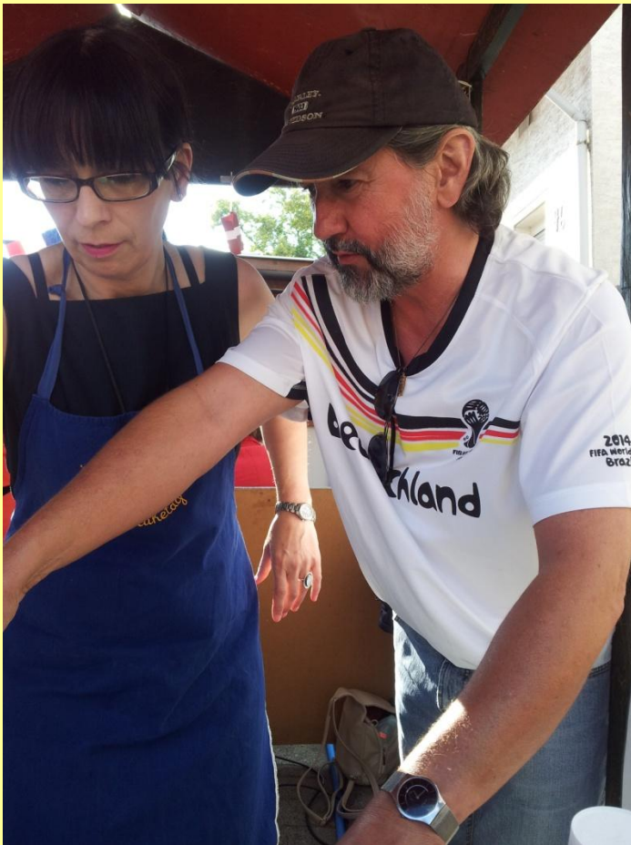
...noch klemmt die Kasse...